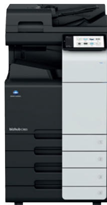
bizhub i-Series C360i