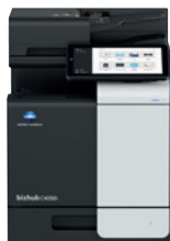
bizhub i-Series C4050i

A medida que su negocio crece, también nosotros crecemos con usted, conectando a la perfección a personas y lugares que aportan una nueva dimensión a su flujo de trabajo documental y la gestión de su seguridad.